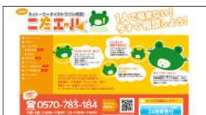
●ネット・ケータイのトラブル相談 こたエール http://www.tokyohelpdesk.jp/