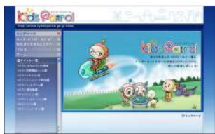
●ゲームで遊びながらルールを学ぼう キッズ・パトロール http://www.npa.go.jp/cyberpolice/kids/