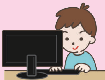
写真 しゃしん やイラスト ぶんしょう 、文章 おんがく 、音楽 おんがく などを自由 じゆう に使う権利 けんり は、作 つく った人 ひと だけが持 も っているものです。ほかの人 ひと が、勝手 かって にブログにのせたり、SNS エヌエヌエス などのアイコン画像 がぞう に使うのはいけ つか ないことです。また、動画共有 どうが きょうゆう サイトにアニメ えいが や映画 かっ を勝手 かって にのせること、本当 ほんとう はのせてはいけ し ないものだと知 し っていてダウンロード はんざいこうい するのも犯 はん 罪 ざい 行為 こうい です。