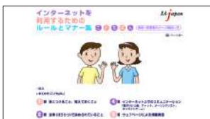
●わからないことはここで確認！ インターネットを利用するためのルールとマナー集 http://www.iajapan.org/rule/rule4child/v2/