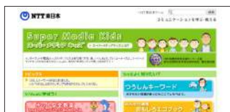
●ネットのしくみも学べるよ！ NTT東日本 スーパーメディアキッズ http://www.ntt-east.co.jp/kids/kids