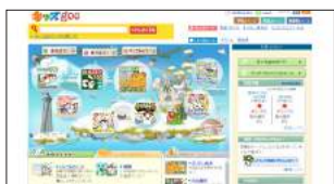
●調べ学習にも役立つよ！ キッズ goo http://kids.goo.ne.jp/