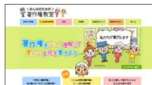
●著作権についても知っておこう みんなのための著作権教室 http://kids.cric.or.jp/