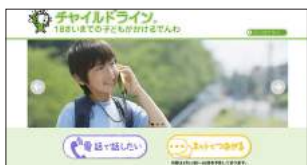
●お悩み相談 チャイルドライン http://www.childline.or.jp/